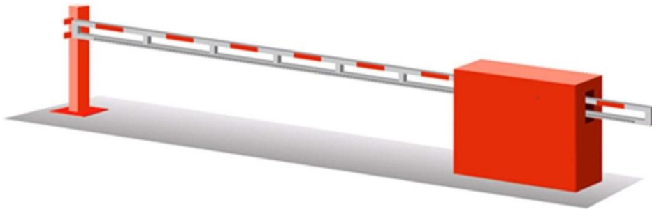
Рис. 3. Внешний вид шлагбаума