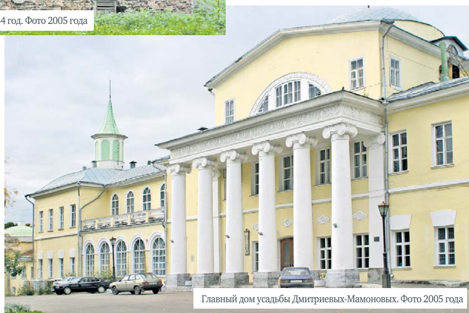
Главный дом усадьбы Дмитриевых-Мамоновых. Фото 2005 года

Семья Капиц жила в двухэтажном особняке на территории ИФП, а семья Се-