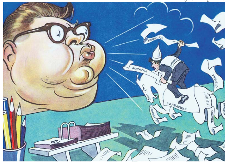
Бюрократический вариант «Руслана и Людмилы»

ИЮНЬ 2021 г. , продолжение следует. Вношу изменение к решению №79/9 и заранее направляю его в управу для со-