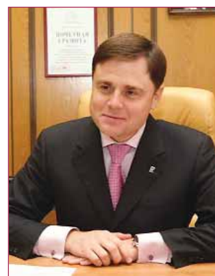
Депутат Государственной Думы, первый заместитель председателя Комитета по гражданскому, уголовному, арбитражному и процессуальному законодательству В.С. Груздев

Примите мои пожелания здоровья, счастья, успехов во всех ваших начинаниях.