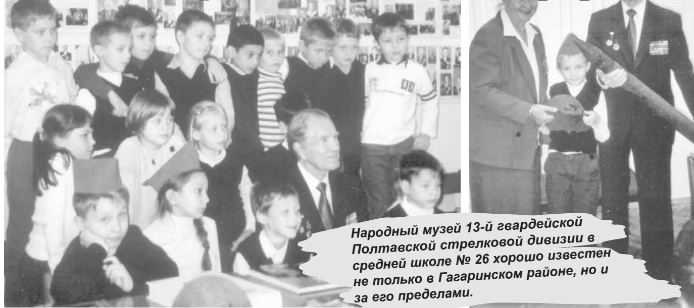
Народный музей 13-й гвардейской Полтавской стрелковой дивизии в средней школе № 26 хорошо известен не только в Гагаринском районе, но и за его пределами.