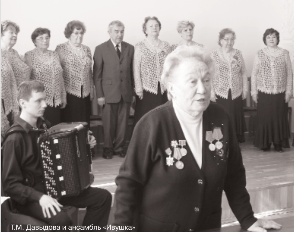
Т.М. Давыдова и ансамбль «Ивушка»