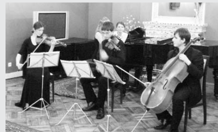
Выступление инструментального ансамбля студентов колледжа и академии им. Гнесиных.