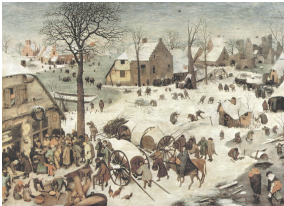
Перепись населения в Вифлееме. 1566 г. Питер Брейгель

Другая книга Ветхого Завета (вторая книга Царств) описывает попытку царя Давида провести перепись населения.