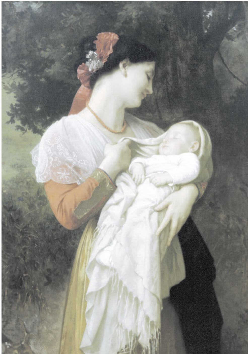
Любовь матери. 1869 г. Уильям Адольф Бугро

Чаще ласкайте и обнимайте ребенка, общайтесь с ребенком в позе «под грудью», когда его взгляд устремлен в ваше лицо. Не бойтесь избаловать малыша, чем больше будет физического и эмоционального контакта, тем лучше. Привлекайте его внимание яркими, блестящими игрушками, находящимися на удобном расстоянии от малыша или помещенными над кроватью. Очень интересным для младенца является человеческое лицо, поэтому купите ему куколок, клоунов, матрешек и неваляшек. Психологи советуют самим нарисовать на картоне доброе, смеющееся лицо и подвесить над кроватью малыша на расстоянии 40-50 см. Развивайте инициативность у ребенка, наполните его жизнь новыми впечатлениями и результат не заставит себя ждать – это счастливая улыбка вашего сокровища!