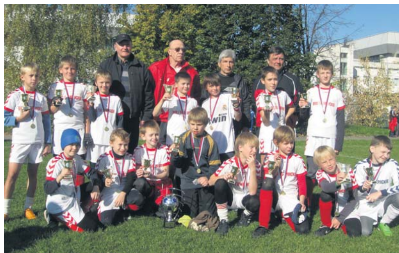
Сборная команда ВМО Гагаринское

Команда ВМО Гагаринское (мальчики 10-11 лет) стала лучшей футбольной командой в столице