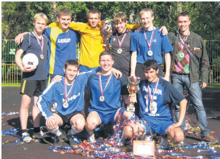
Команда-победитель – Fiorentina