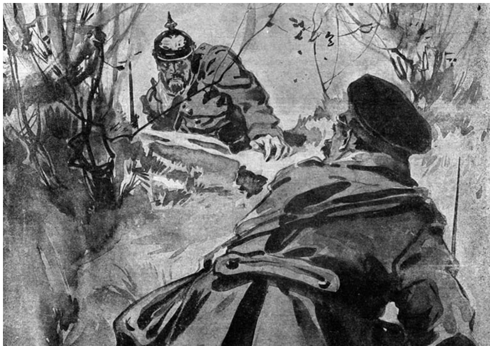
Иллюстрация из газеты «Огонек» времен Первой мировой войны

Результатами 1-й мировой войны стали Февральская и Октябрьская революции, Гражданская война в России, Ноябрьская революция в Германии. Германия, перестав быть монархией, была урезана территориально и ослаблена экономически. Тяжелые для Германии условия Версальского мира (выплата репараций и др.) и перенесенное ею национальное унижение породили реваншистские настроения, которые стали одной из предпосылок прихода к власти нацистов, развязавших Вторую мировую войну.