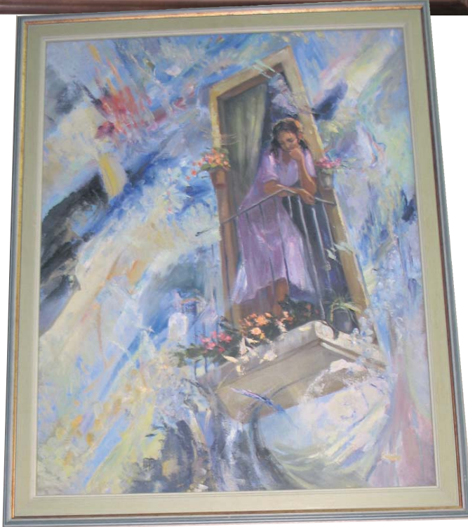
Работы учеников изостудии «Старая школа»