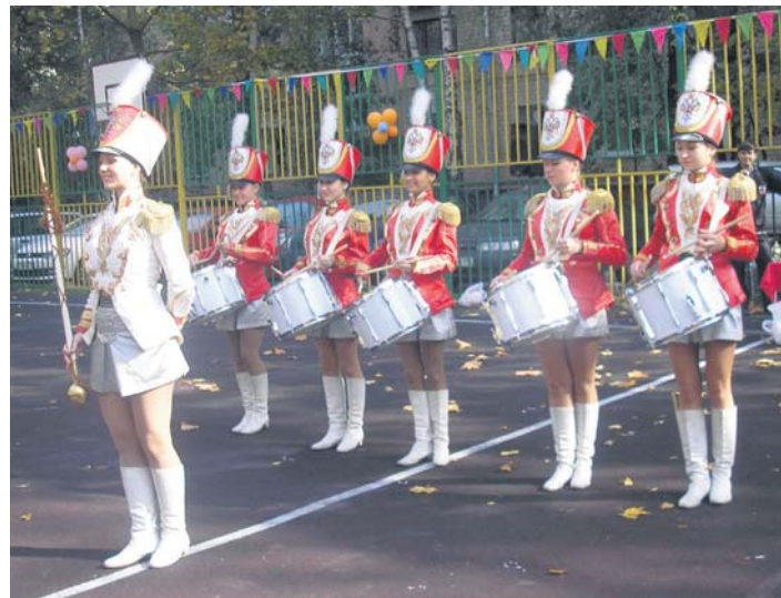
Торжественное закрытие Чемпионата

26 сентября прошли финальные матчи 4-го Чемпионата по мини-футболу на приз ВМО Гагаринское. В результате упорной борьбы со счетом 5:2 победителем стала команда Fiorentina. Кстати, эта команда была признана открытием Чемпионата. Трехкратный чемпион турнира, команда «Ниагара» на этот раз заняла почетное 2-е место. По результатам матча за 3-е место (Real-Gagarino – «Викинг») призовое место досталось команде Real-Gagarino. Эта команда обыграла соперников со счетом 5:0. На финальных играх выступала группа поддержки-черлидинг «Динамик».