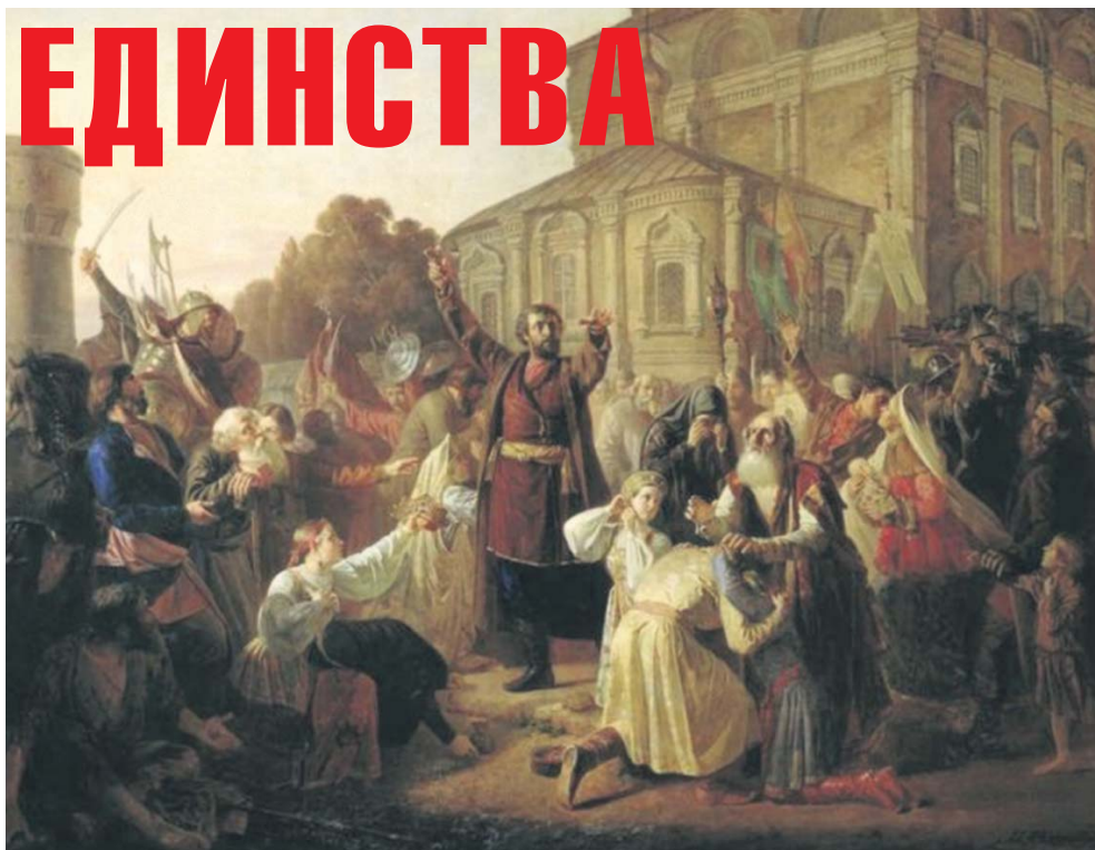
Воззвание Минина к нижегородцам в 1611 году. Песков М.И.

В 1612 г. воины народного ополчения под предводительством Кузьмы Минина и Дмитрия Пожарского спасли от гибели Россию, продемонстрировав образец героизма и сплоченности всего народа вне зависимости от происхождения и положения в обществе.