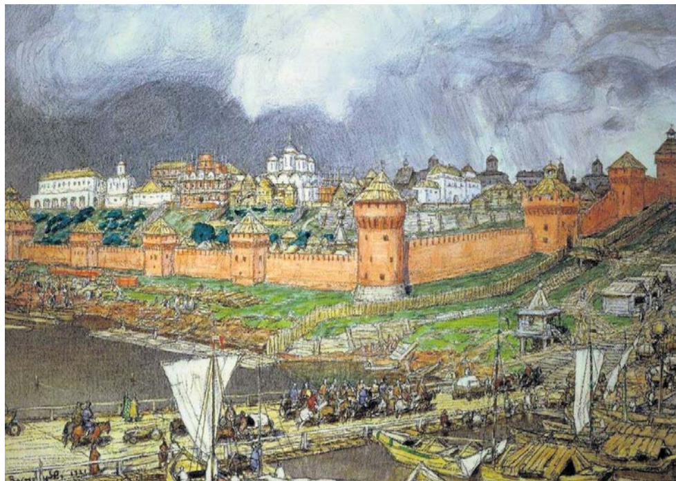
А. Васнецов. Расцвет Кремля

Первый этап переписи заключался в сборе сведений о домах – этим занимались полицейские. В их обязанности входила доставка бланков домовых листов домовладельцам и возврат их в Статистические комитеты. Составление списков квартир должно было существенно облегчить переписывание их жильцов. Эту работу проводили с конца октября и в ноябре, так как это время посчитали самым благоприятным. Саму же перепись населения наместили на декабрь. Москва разбилась на 19 участков, и на каждом закрепили главного исполните-