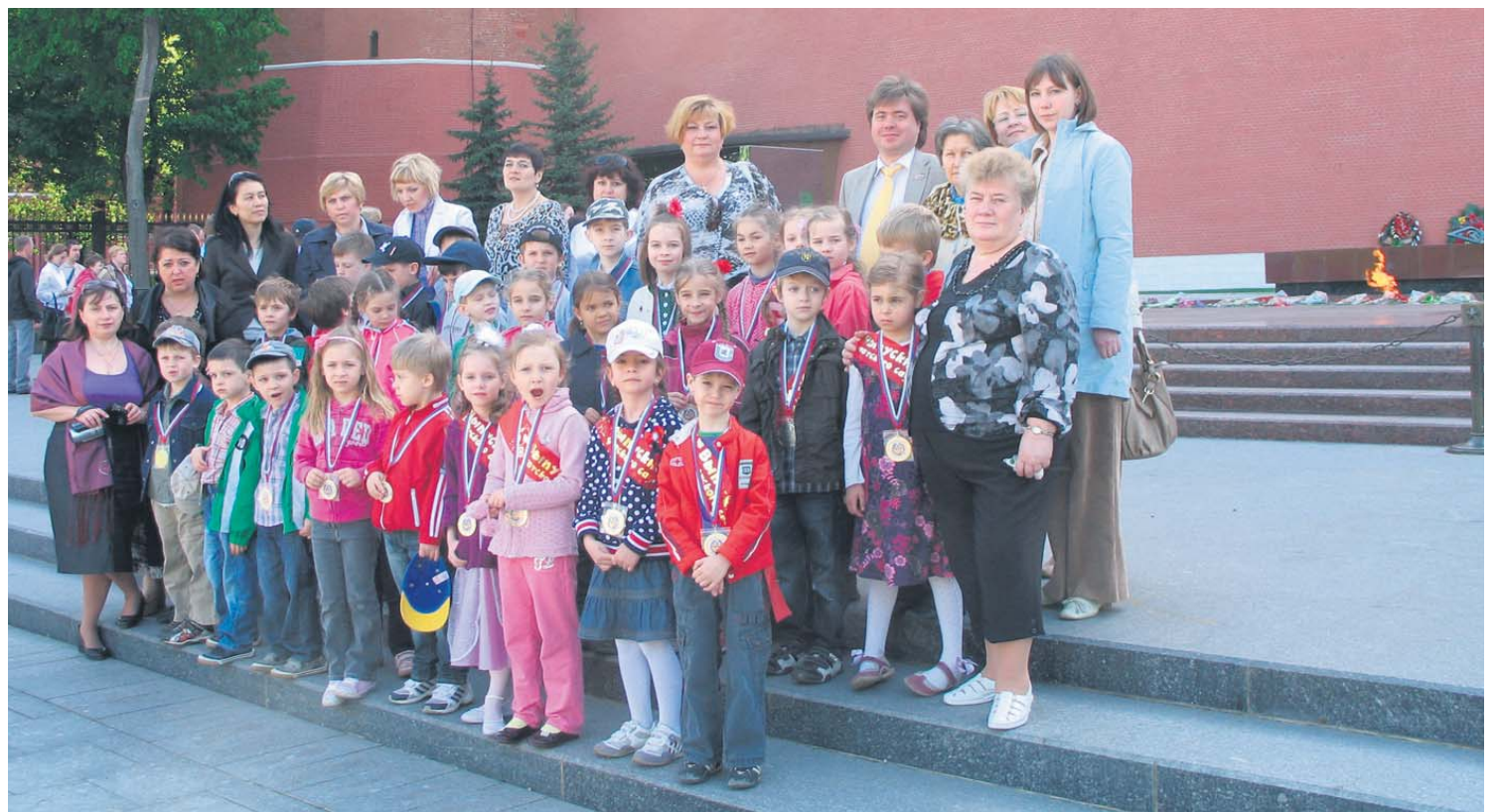
Выпускники д/с № 2042 возле вечного огня около Могилы Неизвестного Солдата

в жизни выпускным и вручил каждому большую золотую медаль выпускника. Во время этой церемонии малыши с удовольствием делились с руководителем муниципального образования своими мечтами о будущем, рассказывали, кем же они хотят стать. А все взрослые желали будущим первоклассникам трудолюбия и хороших оценок.