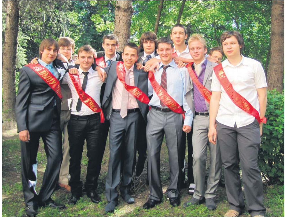
Выпускники лицея «Вторая школа»

колокольчик, даже не подозревая, что эти уже большие (для нее) дяди и тети совсем недавно (для учителей и родителей) тоже были беззаботными малышами. И конечно же, какой последний звонок может обойтись без праздничного концерта, почетных гостей, теплых слов и пожеланий доброго пути.