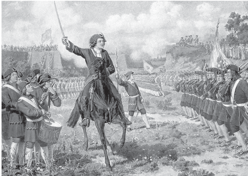
А.Д. Кившенко. Военные игры потешных войск Петра I под селом Кожухово

Регулярная армия была создана при Петре I в начале XVIII в. Ее созданию способствовало поражение русских войск в 1700 г. под Нарвой в битве со шведской армией. Петр I ввел новую систему комплектования армии. Оно стало осуществляться по принципу рекрутского набора, когда 10-20 крестьянских