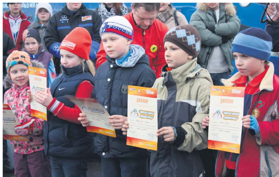
Победители и призеры велотурнира

Всех, кто любит велоспорт и велосипедные прогулки, всегда ждут в этой секции.