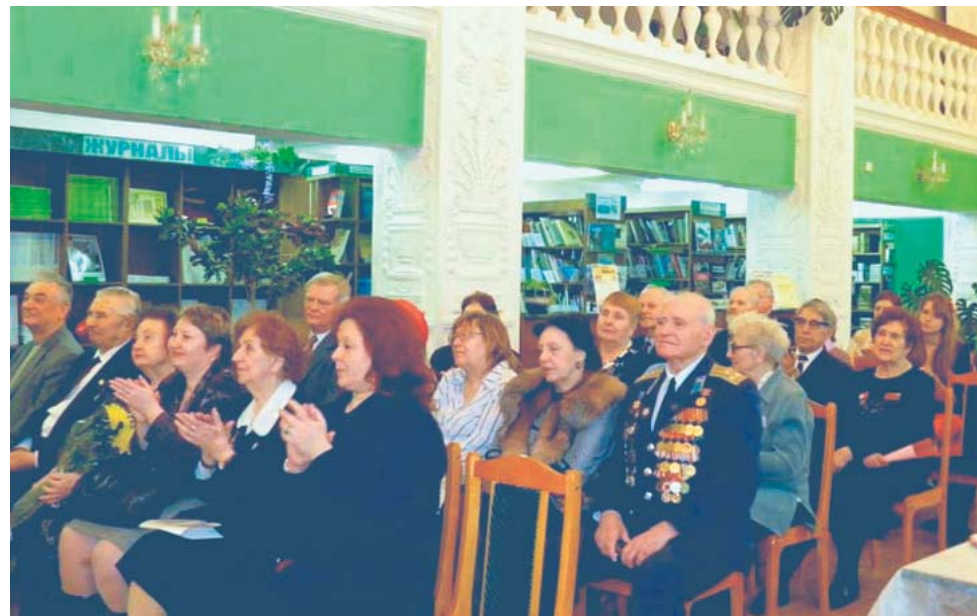
Гости праздника. 2 апреля 2011 г.

лов А.И., лауреат 12 медалей Федерации космонавтики РФ, участвовавший в создании космического корабля «Буран». Встреча началась с праздничного концерта, подготовленного учениками школ № 22 и № 198 совместно с Молодежной общественной палатой Гагаринского района. После концерта ребята пригласили гостей на чаепитие, на котором участники встречи смогли обсудить волнующие их вопросы.