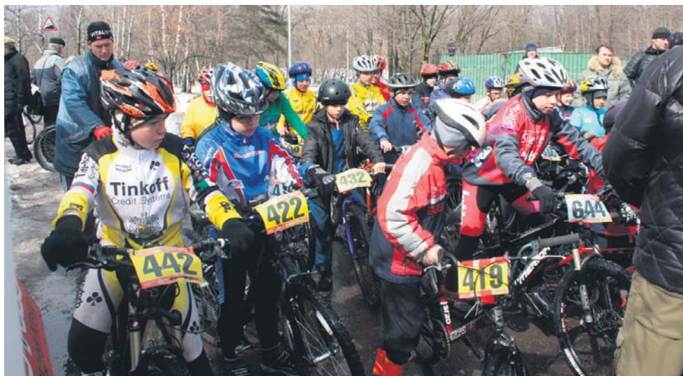
Участники велотурнира готовятся к старту

10 апреля 2011 г. состоялся открытый Кубок ВМО Гагаринское в городе Москве по велоспорту – маунтинбайку, посвященный 50-летию первого полета человека в Космос. Соревнования проводились в рамках этапа открытого Кубка федерации по велоспорту Москвы и Московской области.