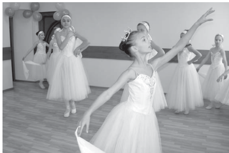
Выступление юных балерин

До ремонта в этом филиале работали студия декоративноприкладного искусства «Творчество», театральная студия «Звездный час», секции современного танца и др. В планы муниципалитета пока не входят изменения в расписании кружков и секций, которые будут работать в обновленном помещении.