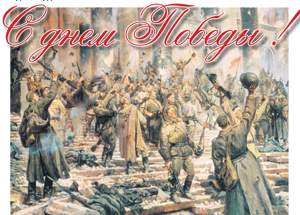
«Победа». Автор П. Кривоногов

Дорогие ветераны! Подвиг ваш никогда не померкнет. Вы служите для нас образцом отваги, верности и чести, примером служения Родине. Мы все равняемся на вас, учимся у вас, мы всегда будем верны тем традициям, которые вы заложили. Желаем вам здоровья, счастья, благополучия и долгих, долгих лет жизни!