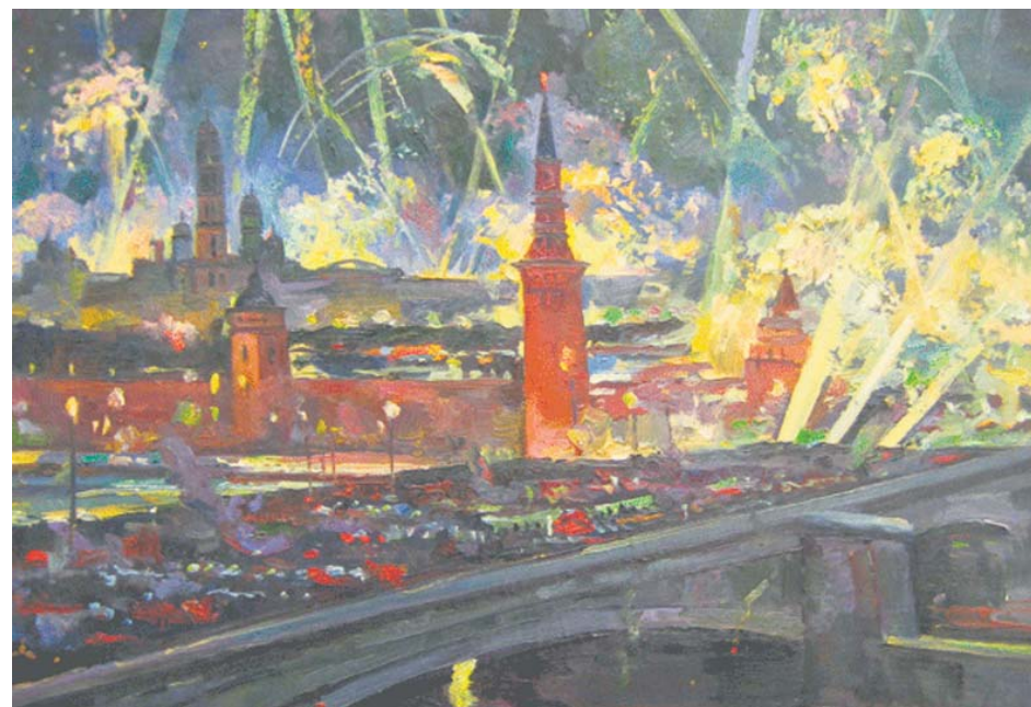
Салют. Художник Канеев М.А. 1960 г.

Муниципальное Собрание Гагаринское и муниципалитет Гагаринский поздравляют жителей ВМО Гагаринское, которые отмечают в январе свои профессиональные праздники.