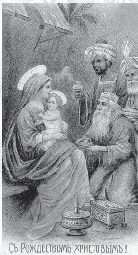
Съ Рождествомъ Христовымъ!

Не является исключением и Рождество, которое отмечают 7 января (25 декабря по юлианскому календарю). На Руси были традиции не только празднования Рождества Христова, но и подготовки к этому дню.