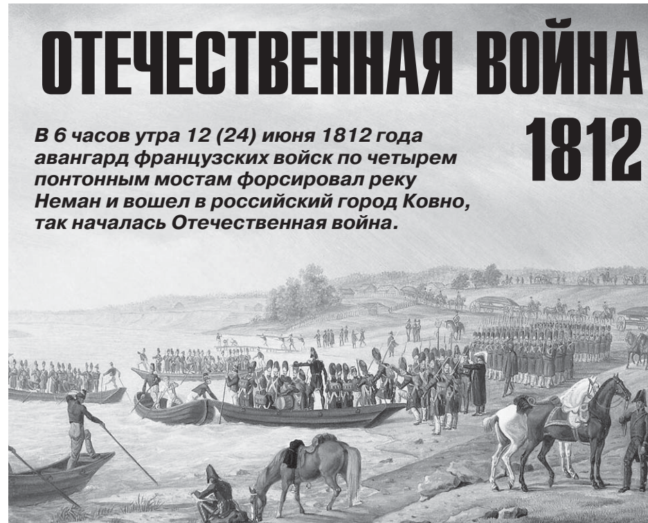
Переправа Итальянского корпуса Евгения Богарне через Неман 30 июня 1812 года. Альбрехт Адам

3 августа 1-я и 2-я русские армии соединились под Смоленском, достигнув таким образом первого стратегического успеха. В войне наступила небольшая передышка, обе стороны приводили в порядок войска, утомленные непрерывными маршами.