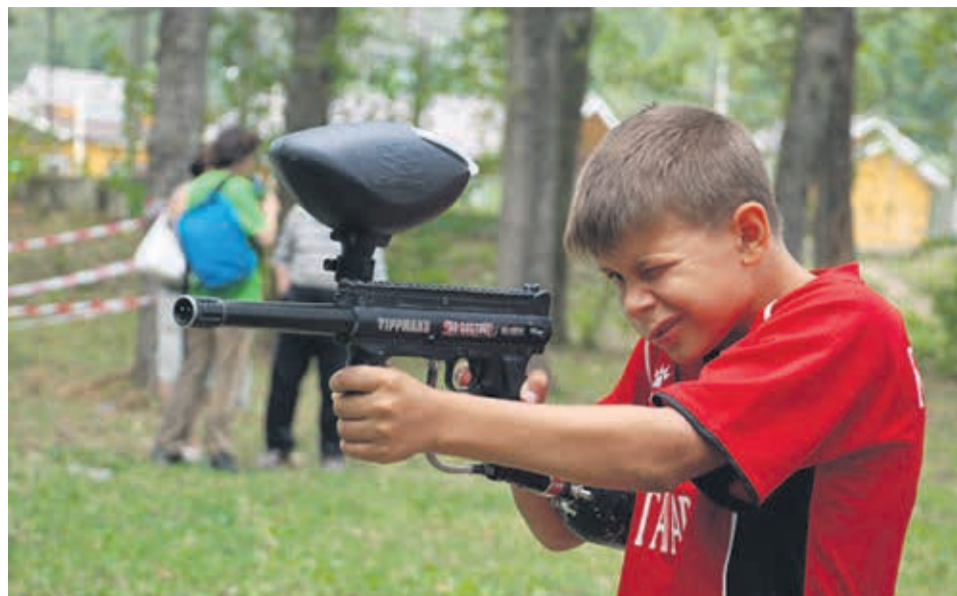
Сборная команда ВМО Гагаринское приняла активное участие!

Программа соревнований состояла из четырех этапов, каждый из которых представлял собой эстафету. Дети (правда, им разрешалось пользоваться помощью родителей) должны были установить палатку, собрать рюкзак, преодолеть полосу препятствий, принять участие в эстафете «Веселые старты». Но и родители не остались в стороне. Женщины выполняли задания на скорость, гибкость и смекалку в эстафете «Самая, самая мама», а мужчины – соревновались в скорости, выносливости и силе, доказывая, что они самые, самые папы.