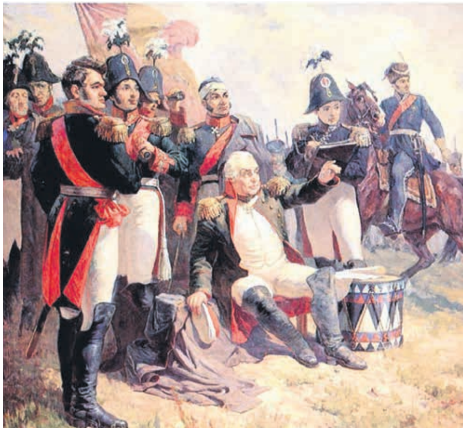
М. И. Кутузов на командном пункте в день Бородинского сражения. А. Шепелюк, 1951.

Бородинская битва – генеральная битва между русскими и наполеоновскими войсками 26 августа (7 сентября) в районе с. Бородино, в 124 км к западу от Москвы, во время Отечественной войны 1812 г. Русские войска под командованием генерала М.И. Кутузова (около 150 тыс. человек, 640 орудий против 135 тыс. человек, 587 орудий у противника) упорной героической обороной и искусными действиями сорвали наполеоновский план разгрома Русской армии в генеральном сражении. Потери наполеоновских войск – около 35 тыс. человек, русских – 45,6 тыс. человек.