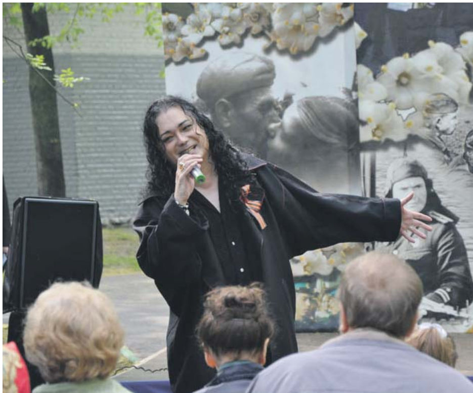
Певец и композитор Игорь Наджиев.