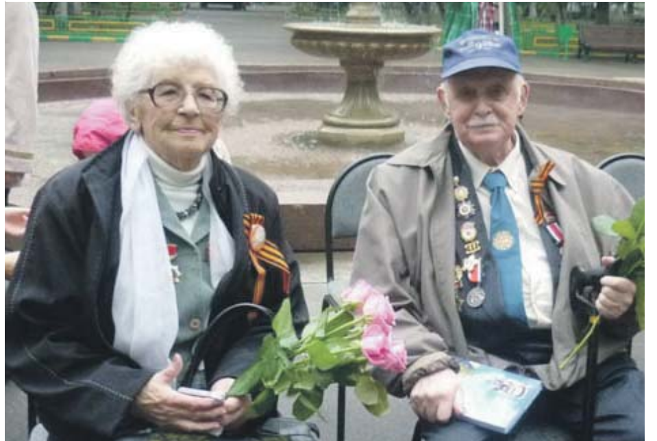
Ветераны ВМО Гагаринское.