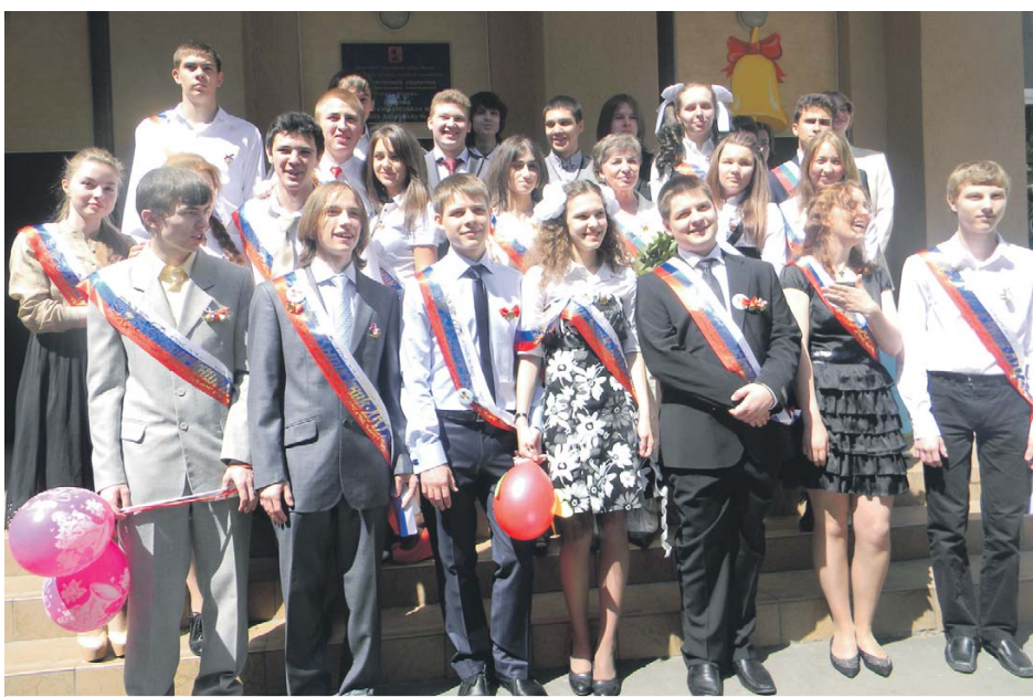
Выпускники ГБОУ СОШ «Школа здоровья» № 198