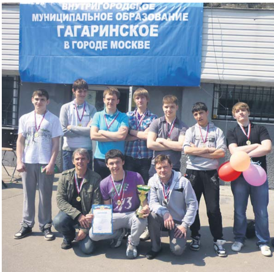
Команда школы № 120.

2-е место у команды ГОУ СОШ № 11, 3-е – ГОУ СОШ № 1260.