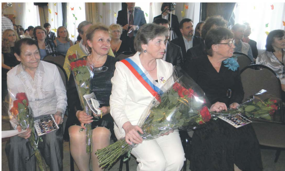
Учителя ГБОУ СОШ «Школа здоровья» № 198