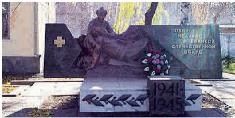
Памятник «Сестренка», посвященный подвигу медиков в Великой Отечественной войне 1941-1945 гг.