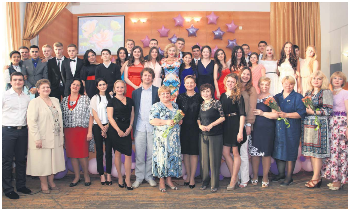
Школа № 198. Выпуск 2014

Желаем, чтобы в вашей жизни было много успехов, удач, светлой радости и как можно меньше огорчений!