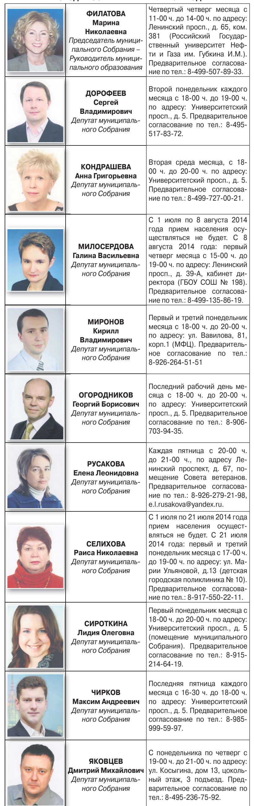
ГРАФИК ПРИЕМА НАСЕЛЕНИЯ ДЕПУТАТАМИ МУНИЦИПАЛЬНОГО СОБРАНИЯ ВНУТРИГОРОДСКОГО МУНИЦИПАЛЬНОГО ОБРАЗОВАНИЯ ГАГАРИНСКОЕ В ГОРОДЕ МОСКВЕ В III КВАРТАЛЕ 2014 ГОДА