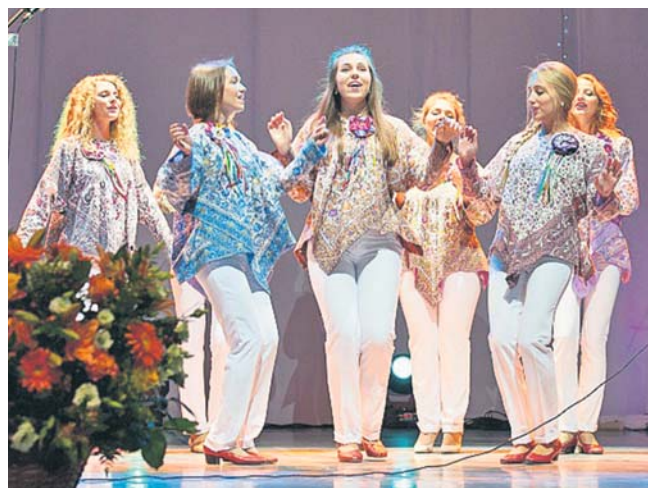
Материалы сайта: http://www.gubkin.ru/