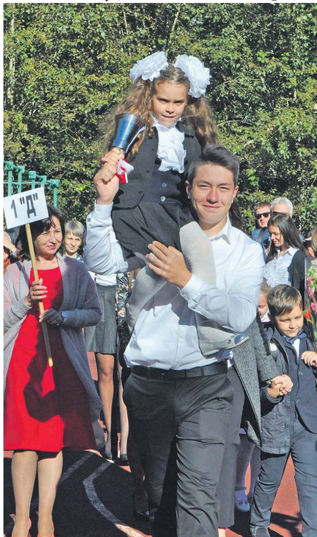
Первый звонок в ГБОУ 192 (СП 198)

Ежегодно 1 сентября в нашей стране отмечается День знаний. В этот первый день осени начинается новый учебный год во всех российских школах, средних и высших учебных заведениях.