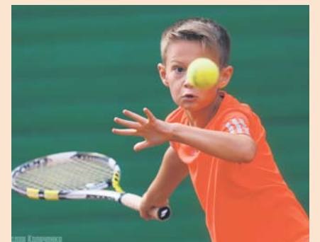
В конце июня прошел детский теннисный турнир «Волокуша»