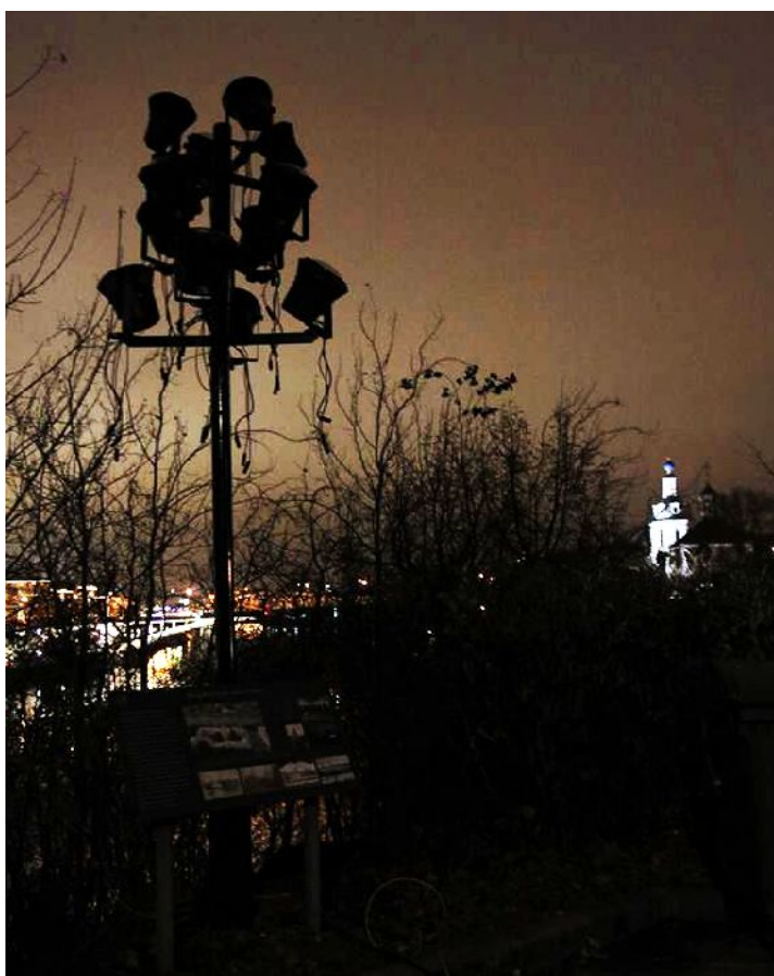
Опора освещения на ОКН, ориентация в сторону Андреевского монастыря