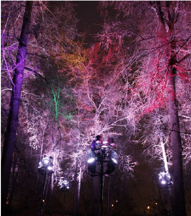
Фото работающей подсветки на территории ООПТ «Природный заказник «Воробьевы горы»

5. Информация о наименовании работ, программе, в рамках которой они выполняются, и Заказчике в Акте ГИКЭ скопированы из нескольких разнородных закупок, проектов и программ.