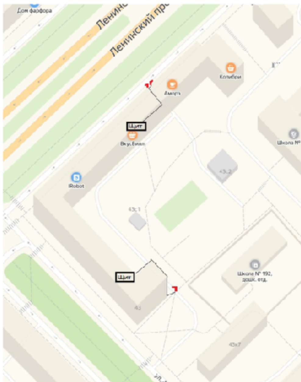
Рис. 1 Схема размещения шлагбаумов

1.2. Тип шлагбаума. Шлагбаум автоматический с электромеханическим приводом подъема и спуска стрелы. Шлагбаум состоит из алюминиевой стрелы и стальной стойки, установленной на бетонное основание и закрепленной болтами, смонтированный в бетонное основание. В стойке шлагбаума находится электромеханический привод, а также блок электронного управления. Привод, перемещающий стрелу, состоит из электродвигателя, редуктора, а также двух пружин, балансирующих вес стрелы. Шлагбаум снабжен регулируемым устройством безопасности, а также устройством фиксации стрелы в любом положении и ручной расцепитель для работы в случае отсутствия электроэнергии.