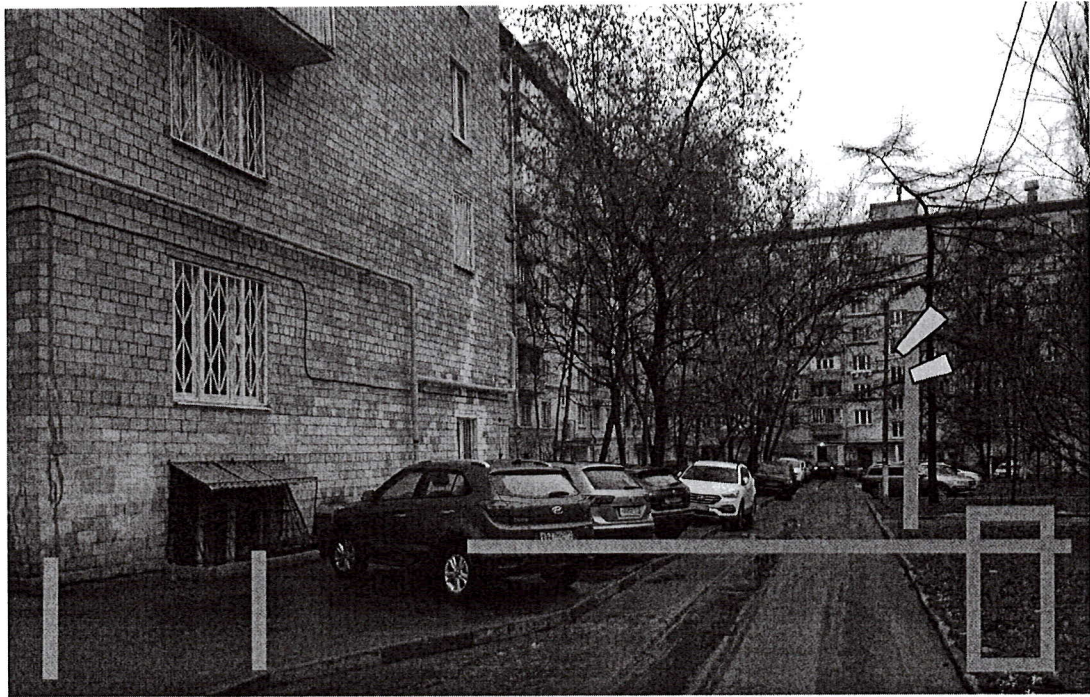
1.5. Технические характеристики шлагбаума: