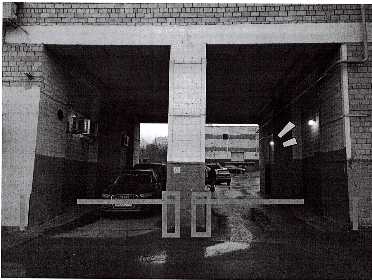
Рис. 1. Внешний вид шлагбаума

Шлагбаум (см. Рисунок 1) состоит из овальной алюминиевой стрелы белого цвета с зеркальными отражательными поперечными полосками красного и белого цвета. Стойка шлагбаума снабжена сигнальной лампой оранжевого цвета для предупреждения водителей транспортных средств и пешеходов, об опускании (поднятии) стрелы шлагбаума.